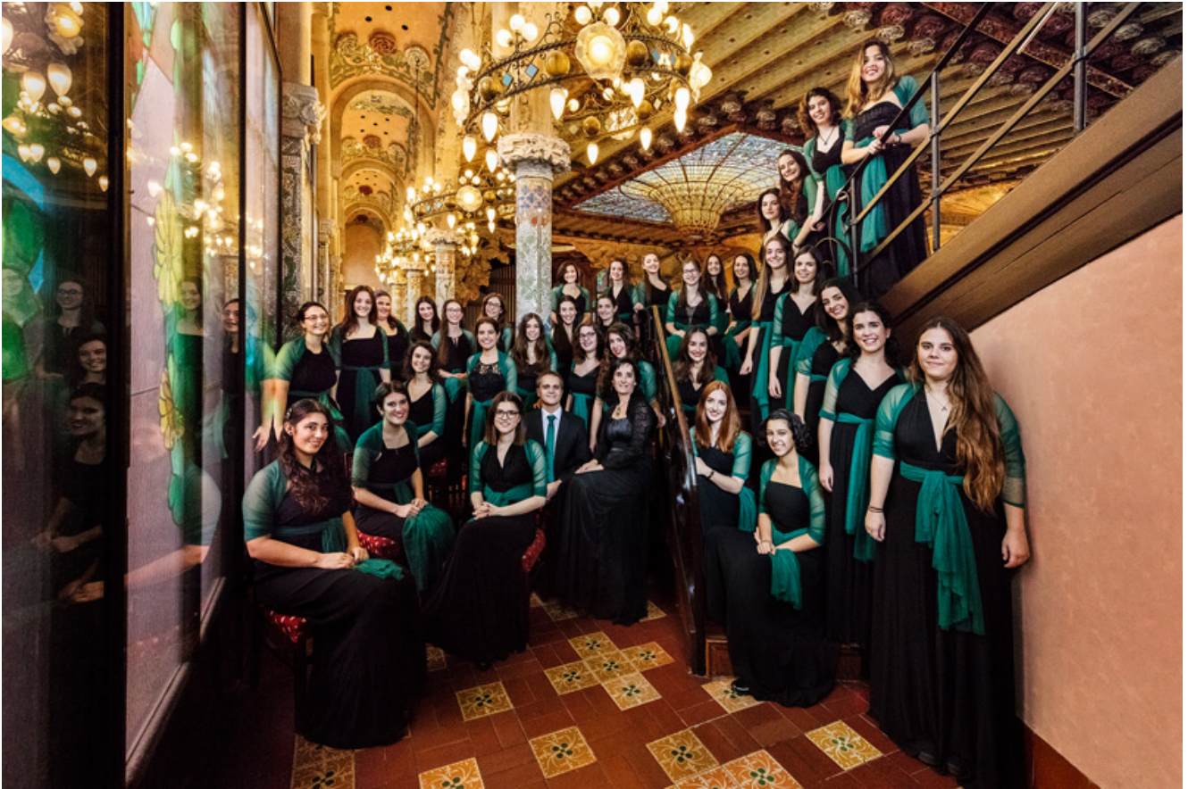
Cor de Noies de l'Orfeó Català.

L'orquestra barroca Vespres d'Arnadí, junt amb el Cor de Noies de l'Orfeó Català oferiran dos concerts a Tremp i Berga, els dies 5 i 6 de juliol, respectivament, a la recerca dels sons de l'antiga Europa. La soprano Elena Copons interpretarà junt amb Lieder Càmera un programa novament amb motiu del 400 aniversari del naixement del compositor Joan Cererols; serà el 12 de juliol a la Seu d'Urgell i l'endemà a Bagà. El mateix dia, el 13 de juliol, el quartet The Illyria Consort explorarà la música vienesa del segle XVII, programa que repetirà l'endemà, dia 14, a Berga. Un altre quartet, el Quartet Teixidor, interpretarà música de Mozart i Haydn al refugi de l'estany Gento (14 de juliol) i a Avià (15 de juliol).