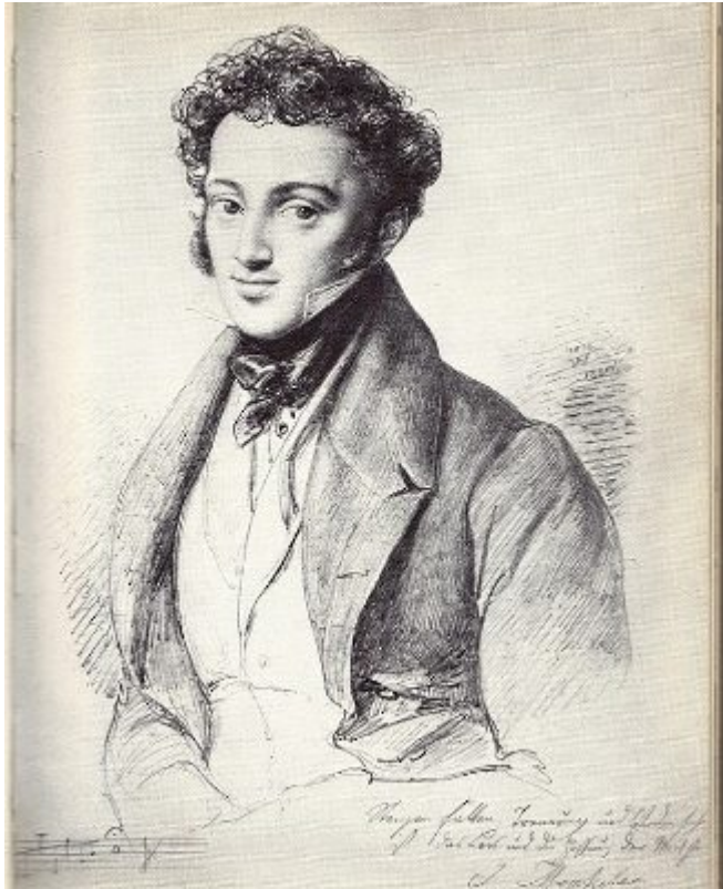
Retrat de Sir George Smart, per William Bradley (esquerra) i d'Ignaz Moscheles, per Wilhelm Henselt, 1832 (dreta).