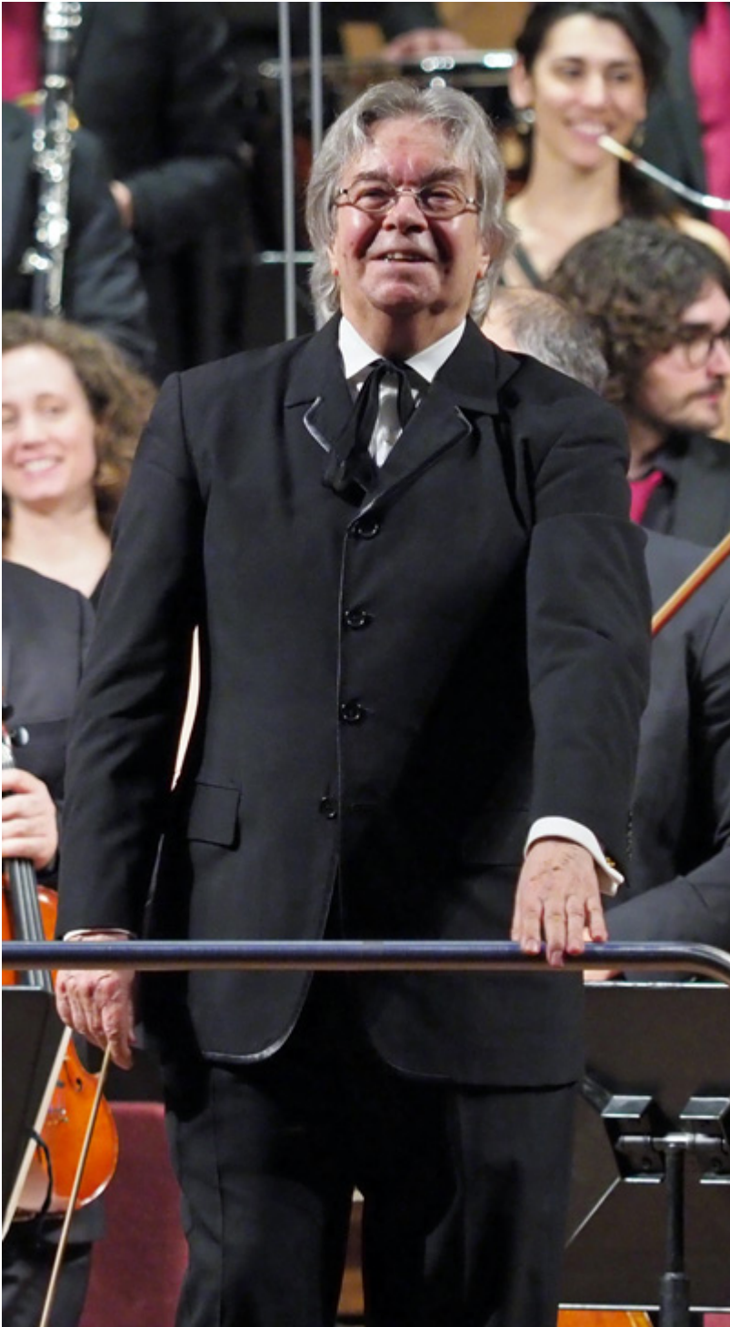
Antoni Ros Marbà.