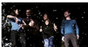
14.08 / AMANDINE BEYER presenta Kitgut Quartet