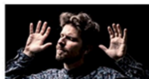
22.08 / MARCO MEZQUIDA Orquestra Simfònica del Vallès