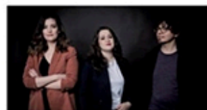
18.08 / TRIO DA VINCI