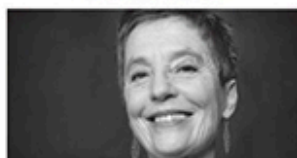
21.08 / MARIA JOÃO PIRES