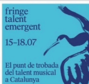
fringe talent emergent 15–18.07

El punt de trobada del talent musical a Catalunya