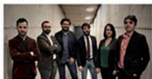
13.08 / FORMA ANTIQVA