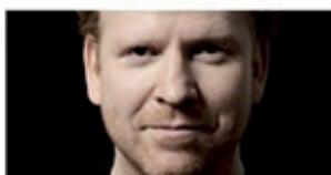
01.08 / DANIEL HOPE