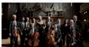
20.08 / I MUSICI