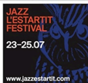
JAZZ L'ESTARTIT FESTIVAL 23–25.07

El punt de trobada del talent musical a Catalunya