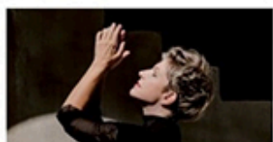
31.07 / JOYCE DIDONATO