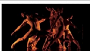
30.07 / CONSAGRACIÓ DE GERHARD I STRAVINSKI