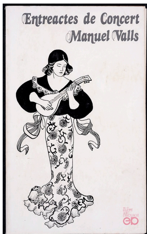
Portada del llibre Entreactes de concert , editat per Pòrtic (Barcelona, 1973).

L’exposició s’estructura en cinc àmbits temàtics: “Entreacte biogràfic”, “Entreacte musical”, “Entreacte crític i d’assaig”, “Entreacte estètic-perceptiu” i “Entreacte social”. Entre la documentació podem trobar des del certificat de naixement, fins a carnets diversos i passis de premsa, a més de partitures dedicades a cantants, com Conxita Badia o Anna Ricci. També hi ha fotografies, programes de concert, correspondència i enregistraments discogràfics, a més d’altres materials.