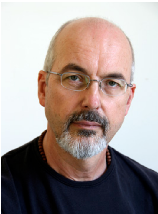
Bill Viola.

La Fundació Catalunya La Pedrera organitza l'exhibició "Bill Viola. Miralls de l'invisible" que s'inaugura avui, 4 d'octubre, i es podrà visitar fins al 5 de gener de 2020. Per la seva banda, el Palau de la Música Catalana i el Gran Teatre del Liceu participaran en aquesta iniciativa amb la Nit Bill Viola.